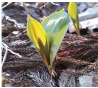
成長中のカククリ