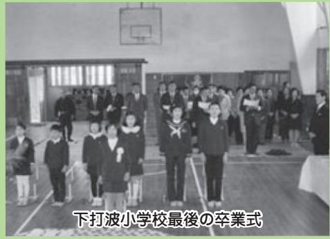
下打波小学校最後の卒業式

我らの遊ぶ学びやは 打波川のそのほとり 山は秀でて水清く 人の心もすがすがし ここに生立つ我子らよ 朝な夕なにその業を つとめはげみて もろともに 国の光をあげよかし