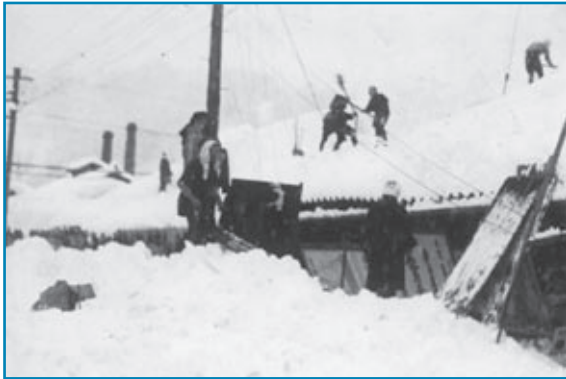
昭和11年豪雪：昭和11年2月撮影

昭和11年2月は、連日の降雪で大変な大雪となりました。屋根雪の重みで、家が倒壊する恐れがあったため、各家庭では必死に屋根雪下ろしをしたそうです。