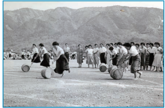
上庄地区総合体育祭：昭和32年8月撮影

上庄地区総合体育祭での、たる転がし競争の様子です。ゴールを目指し、一本の棒を使ってたるを転がすのは、なかなか難しかったようです。この日は、ほかにリレー競技なども行われ、多くの区民でにぎわっていました。