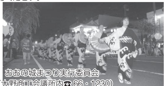
図 おおの城まつり実行委員会 (大野商工会議所内 ☎66・1230)

グループなどで「越前おおのおどり」を練習する場合、指導者を派遣します。詳しくは、問い合わせてください。