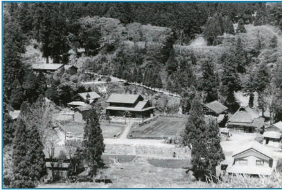
宝慶寺の集落：昭和30年代撮影

これは、宝慶寺に至る参道と宝慶寺地区の集落を撮影したものです。右端の参道登り口には、かやぶき屋根の家があります。左端奥の木々の間に見えるのは宝慶寺小学校ですが、児童数が減少したため昭和45年3月に廃校となりました。