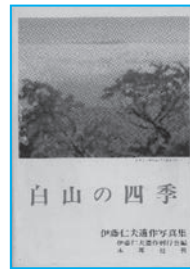
『白山の四季』 伊藤仁夫 著 木耳社 発行