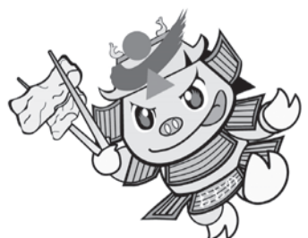
イメージキャラクター「セントン君」

○無料駐車場 城下町東広場(大和町) や市役所駐車場(天神町) が利用できます ☎ 越前おおのどんちゃんを愛でる会 ホームページ http://tonchaan.com 電子メール