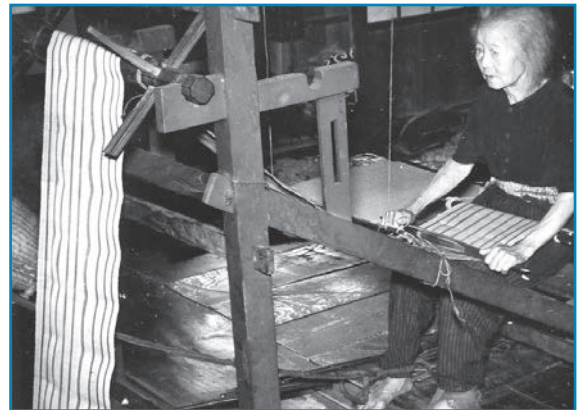
機織り：昭和30年夏撮影

昭和40年9月の奥越豪雨をきっかけに、下若生子に真名川ダムが建設されました。真名川ダムは高さ127mのアーチ式コンクリートダムで、10年の歳月をかけて昭和52年に完成しました。