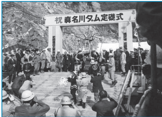
真名川ダム定礎式：昭和47年撮影

昭和40年9月の奥越豪雨をきっかけに、下若生子に真名川ダムが建設されました。真名川ダムは高さ127mのアーチ式コンクリートダムで、10年の歳月をかけて昭和52年に完成しました。