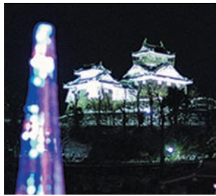
六角イルミネーション