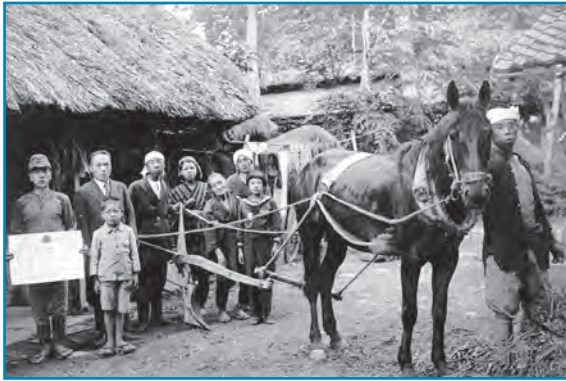
馬耕競技会：昭和15年ごろ撮影

馬耕競技会での優秀な成績を記念して撮った写真です。馬耕競技会は田起こしの技術を競うもので、大正の終わりから昭和にかけて盛んに行われました。農耕馬は家族同然の存在で、農家では大切に飼われていました。