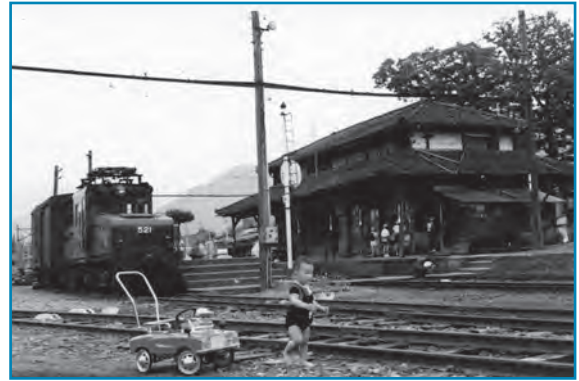
京福電鉄大野口駅：昭和49年ごろ撮影

大野口駅は地元産業を支える貨物ターミナル駅として、物資の輸送でも重要な役割を果たしていました。「テキ521」は、福井地震の復旧資材の運搬などのために、昭和24年に導入された電気機関車です。