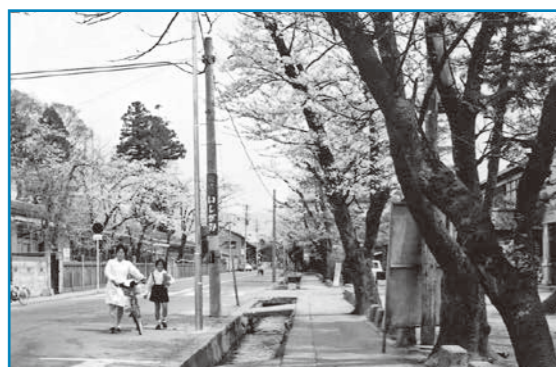
有終南小前通り：昭和48年撮影 昭和48年の春、当時の有終南小学校前の通りの風景です。現在はかえり通りとなったこの道には当時両脇にたくさんの桜の木があり、美しい桜並木を楽しむことができました。 (提供：大野商工会議所)