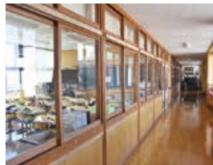
子どもたちがいない 小学校

新型コロナウイルスの感染拡大防止のため、学校は休業、市内外で予定されていた行事も多くが中止となっています。花のつぼみも膨らみ、心浮き立つ季節なのに、先が見えない不安に駆られる春になってしまいました。1日も早くウィルスの猛威が治まり、ひっそりと静まり返る校舎に子どもたちの元気な声が戻ってきますように。