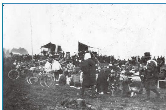
善導寺鐘鑄：昭和11年撮影 現在の奥越ふれあい公園の辺りにあった大野競馬場で、善導寺の釣鐘を鑄造しているところ。釣鐘の鑄造は珍しいため大勢の人が見物にきています。

大野の歴史・文化・伝統を記録した写真などを収集保存しています。家庭に古い写真などを持っている人は、ぜひ連絡してください。皆さんの協力をお願いします。 ☎ 生涯学習課 (☎65・5590)