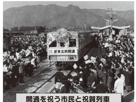
開通を祝う市民と祝賀列車

——住民挙げての祝賀行事 市では12月12日から6日間にわたり開通を祝う行事を行いました。小中学生が描いた鉄道の図画や鉄道写真、機関車の模型、切符、記念切手などが展示されたほか、NHKの全国放送番組「軽音楽ホール」の公開録音が行われたり、前夜祭として「のびゆく鉄道」や「日本の動脈」などの映画が上映されたりするなど、市内はお祝いムードに包まれました。