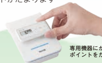
専用機器にかざしてポイントをとります

③ポイントをためる機器は大野公民館を除く各公民館、結とぴあにあります。コンビニエンスストアのローソン店内にあるLoppi(ロッピー)でも同じようにポイントがためられます