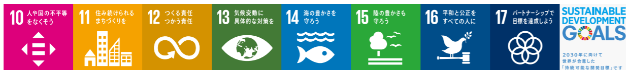
図 総合政策課 (☎64・4824)

本市の広大な森林や清らかな河川を守ることは、動植物の生態系だけでなく、おいしい飲み水や空気など、私たちの日常生活に欠かせない貴重な財産を守り、「15：陸の豊かさを守ろう」にもつながります。