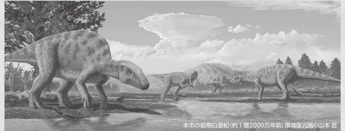
本市の前期白亜紀(約1億2000万年前)環境復元画©山本 匠