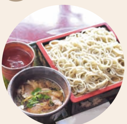
※「あったかいつけそば」の内容は店舗により異なります

参加店舗 大野食堂・お食事処 しもむら・そば処 梅林・そば処 福そば 陽明店・そばはうす ゑびすや・名水手打そば お清水