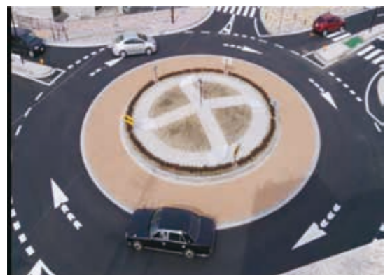
ラウンドアバウトのイメージ