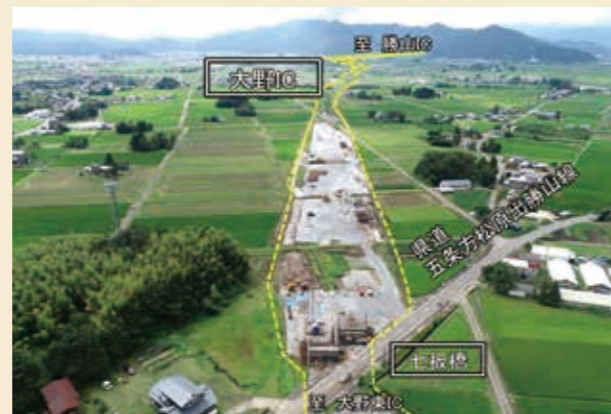
②新塚原区(10月末時点)