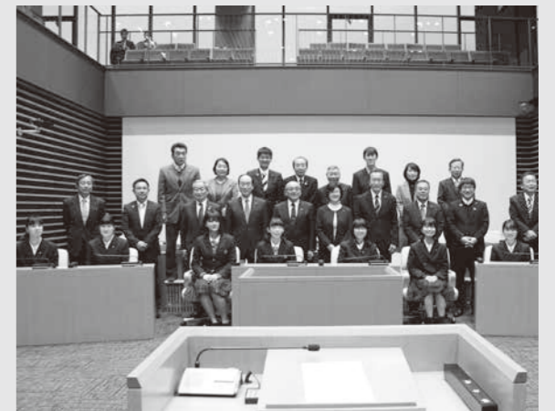
第1回高校生議会開催時の記念撮影の様子