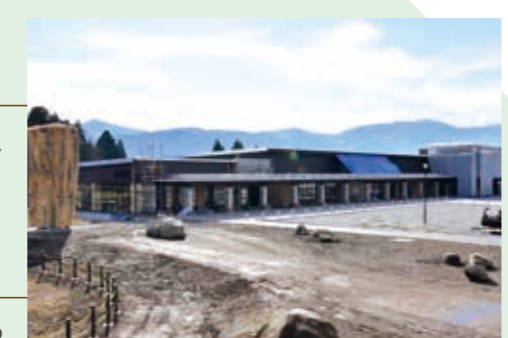
工事が進む道の駅「越前おおの 荒島の郷」(12月9日時点)

道の駅のランドマークとなる「クライミングピナクル」も設置され、開駅に向けて順調に工事が進んでいます。