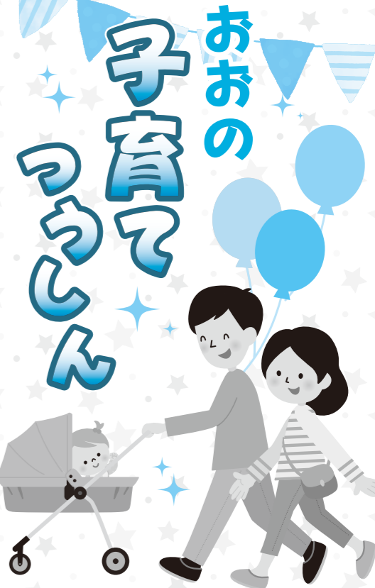
SDGs目標 No.3.すべての人に健康と福祉を