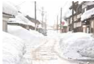
大野を襲った令和の大雪

県内を襲った大雪。本市と福井市には県内で初めて「顕著な大雪に関する福井県気象情報」が発表され、ピーク時には市内の友江観測所で積雪180センチを2回記録しました。また、1月8日午後3時までの12時間降雪量が56センチとなり、平成30年豪雪時の記録を更新。統計開始以来最多となりました。今回の大雪で被害に遭われた皆様に心よりお見舞い申し上げます。