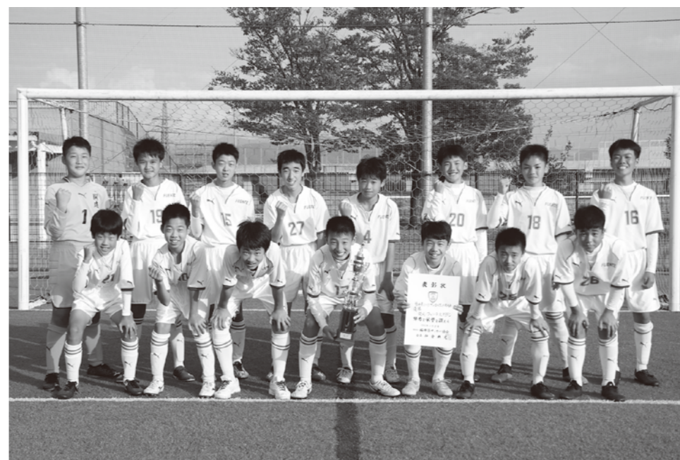
開成・フェンテ大野FC