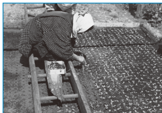
葉タバコの栽培：昭和30年撮影

小山地区で撮影された、葉タバコの苗の植えの様子です。葉タバコは各地区で栽培され、コメに次いで作付面積の多い作物でした。