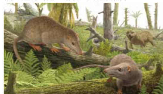
「真三錐歯類」などの復元画(山本匠さん提供)