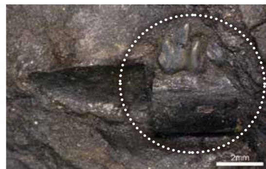
「真三錐歯類」の化石の一部