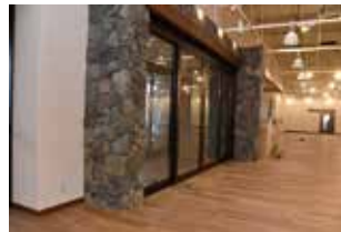
大野の岩石で形どられた道の駅の出入口

編集後記 道の駅「越前おおの荒島の郷」の整備状況を本紙で紹介するため、建物内にお邪魔しました。ふと、岩石で形どられた扉が目。建設現場の人に尋ねると、中部縦貫自動車道の工事現場で産出した岩石の中から、形の合うものを手作業で探し、利用しているのだとか。地元の材料を使うとする細やかな配慮が、魅力につながっていくのだと思いました。そんな道の駅の開駅はすぐそこまで迫っています。オープンが待ち遠しいですね。