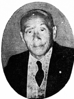
大野市長 齋藤重雄

昭和三十年の新春を迎え、年頭の御祝辞を申し上げます。年々方々めぐり来る正月は何時どの年でも輝かしい希望が持たれどかな喜びを感じるものであります。本年は我々大野市民にとつてはとりわけ祝福を感じると共に一陽来春心機一振の気概の満ちた新年を迎えたいと思つております。それは年来の宿願であつた大野市