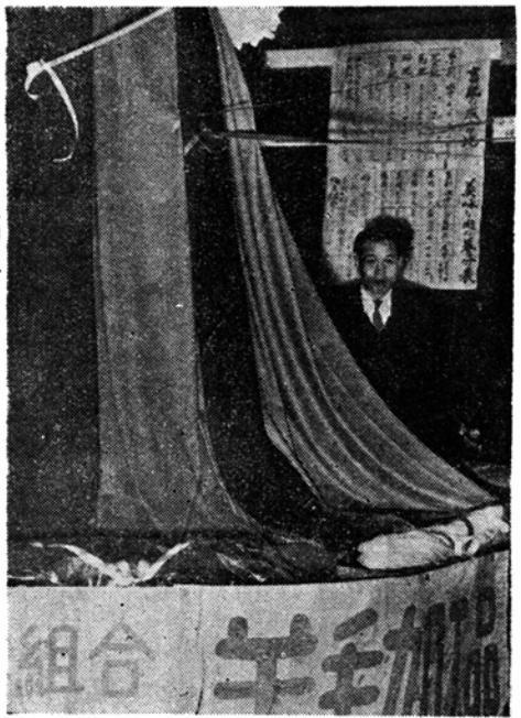
(写真は羊毛加工製品服地と毛糸)