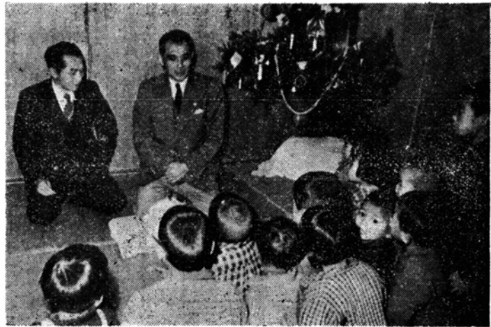
市の歳末慰問風景 (善隣館)