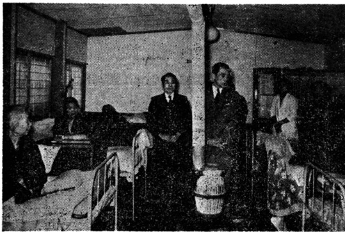
市の歳末慰問風景 (養老院)

火の気の少ない寒い部屋で元気になる。オジサン有難う有難うの連絡に送られ、県下で設備の完備しているので名のある和光園を自宅近くの気の毒な方々を慰問、病室で動けない十名余りの方にも御慰まめの言葉を述べるとベットに起なされた患者の暗い面々にも一瞬ほころびが見られた。