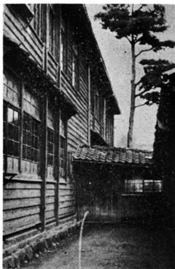
(古びた西校校舎の一部)

幸い各方面の協力を得て補助金と起債の見通しが立ち、ようやく追加予算に計上して、いよいよ改築されることになり