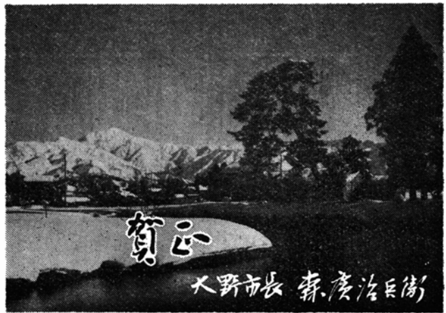
秀峯荒島岳や赤根川の清流も、太古そのままの姿に昭和34年の元朝は明け初めました。亥年にちなみ、今年さらに5万市民一致団結し大野楽園の建設に努力することを誓いましょう。