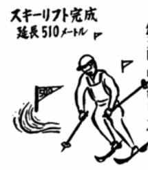
スキーリフト完成 延長510メートル