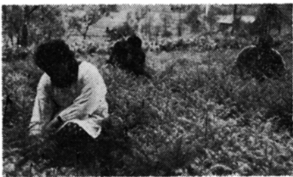
(杉の稚苗育成する会員たち)

の春から杉の稚苗育成を計画し二万本の稚苗の育成に当りましたが、この育成も良々で会員を喜ばせています。 その上農業経営の合理化の第一歩は農道の充実完備であることを受感し、市に働きかけ補助を受けて、三三・四メートルの農道が三十三年に完成したほか、三十三年にはさらに七五・六メートルの農道が農閑期を利用してできあがりしました。