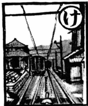
郷土いろはかるた 京福電鉄大野の動脈

①市街地の道路をブルドーザーで除雪したときは、各戸の入口の雪の始末は各戸が協力的に行うこと。 ②市街地の各戸に面した道路の除雪は、戸々の責任で行い町内の通りの除雪は町内全体の責任で行うようにつとめること。 ③雪の処置については一挙に川へつめ込んで水の流れをさま