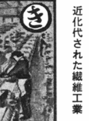
近化代された繊維工業

明治の初期、近郊産のまゆを原料とした「書羽二重」の生産に始まり、大野の織物工業は、昭和七年頃から新しい人絹織物に転換し、最近ではナイロン、テロン織物に近代的な設備と技術を導入した工場も出てきました。