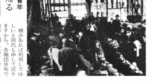
海外派遣青年 黒原君帰る