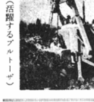
活躍するブルドーザー

家一〇ヘクタール、上荒耕地も十二アールを耕作する上庄中上庄中学校は昨年産業教育の指定校に選ばれ、耕種機、脱穀機、モミシなどの農機具を取り揃え、農業に必要な知識、技能の向上に努めて大きな成果をあげています。