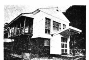
公民館は九頭竜川の景勝地東陽原(藤原橋を渡つたところ)に建坪352平方メートルの二階建てのものです。

身体障害者の実態調査について 昨年の七月に身体障害者雇用促進法が制定され、身体障害者の就職について、皆さ様の悩みを解消するよう政府でも本腰を入れる事になつてきました。これからもあらゆる面において皆さん方に利益のあるように法の改正が予想されます。県、国共に皆さ様のため、前もつて市、区、国共に皆さ様の現状を知つておかねばなりませんので、八月一日現在で実態調査をおこなうことになりました。つききの日程により当日身体障害者手帳を持つておられずおいで下さい。なお本人がおいで願えない場合は本人の現況を知つておられる方が出席して下さい。 記 大野地区 八月十七日 市役所分室 下庄地区 八月十八日 大野公民館 下庄地区 八月二十一日 下庄出張所 乾側地区 八月二十二日 乾側出張所 小山地区 八月二十四日 小山出張所 上庄地区 八月二十五日 富田出張所 富田地区 八月二十八日 富田出張所 五箇地区 八月二十九日 五箇出張所