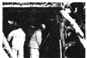
で、魚見橋と七板発電所 取入口間約

なだれでこわれた昭和和路(唯野地係)の復旧は、工費850万円で12月から本工事に着手されました。この水路は唯野、蕨生地区の水田39ヘクタールをうるおす唯一のもので、昨年の大雪