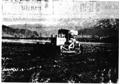
この事業は、農協が主体となつて、9カ年計画、総工費8千813万円、水田67.22haの区画整理を行なうとともに大型農機具の導入や共同施設を完備して、水稲の大幅な省力栽培を行うことになっていきます。初年度として中野14.15ha、庄林21.91ha、西市7.78haの区画整理事業と、上中野に共同育苗施設(建坪123平方m、鉄骨合掌造り、ビール二重張り)、それに下中野の下鹿線東側に大型穀物乾燥場(循環式15石乾燥機8台)を新設することになっていきます。

下野の上、下中野、西市、庄林の4部落は全国でも数少ない農業構造改善事業のパイロット地域(補助対象地区)に指定され、さる10月には農林省の事業仮認定を終え、初年度事業として、工費2千880万円、43.22haを、一区画30~60aの区画整理に着手しました。起工式は12月7日におこなわれ、現在3月末完成を目標として工事が急がれています。