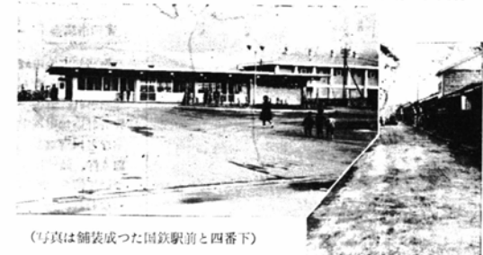
(写真は舗装成つた国鉄駅前と四番下)