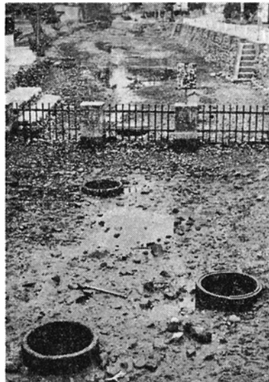
昨年12月に枯れ上がった本願清水

歳入歳出にそれぞれ1億3,539万5,000円を追加し、今年度の一般会計の総額は