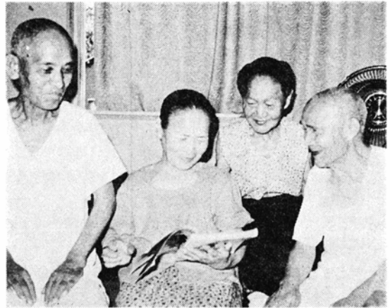
健康で豊かな暮らしを語り合うお年寄り

これは所得比例制といわれているもので、普通の保険料の外に任意の附加保険料(月350円)を掛け、年金を多く受けるものです。