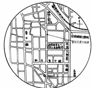
写真は舗装工事が進む駅前向島大桜線

この道路は国鉄駅前から国道158号線バイパスへと市街地を南北に通じる重要な幹線道路です。特に春日地域、小山地区、木ノ本、宝慶寺などへは交通の混雑がなく、しかも近距離で行くことができます。又これからますます観光客の多くなる宝慶寺への観光道路としても大いに役立ちます。