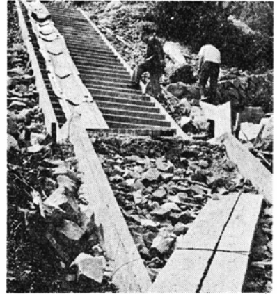
きれいな階段ができた遊歩道工事