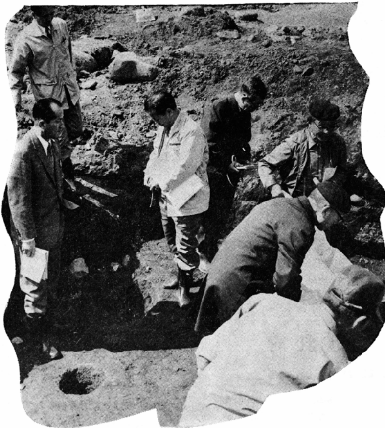
住居の柱跡 いろいろ跡を調べる関係者

対策会議では、佐開遺跡の住居跡の状態や、出土品から見て、次の点で文化財として価値のあるものと判断しました。