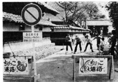
きようは安全だ……チビッコ道路

チャンバラごっこや、草花を摘んでのママごと遊びに代表される昔の遊びに比べて、現今のこどもの遊びは遊び道具に