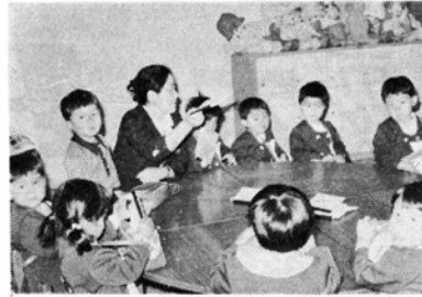
家庭連絡帳をもらう園児

保育園、園児数は昭和48年4月1日現在 市内の児童数は昭和47年10月県統計課資料による