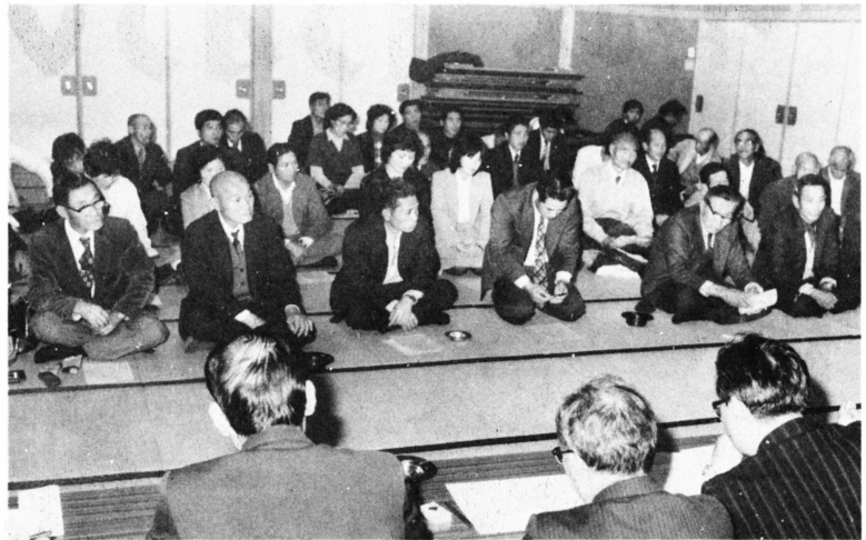
熱のこもった座談会(小山公民館)

恒例の市政座談会が10月26日から11月20日まで、各公民館や小学校など9会場で開かれました。これは市民のみなさんの要望や意見を市政に反映させようとするもので、どの会場にも多数が参加。市側からは市長・助役・教育長をはじめ各関係課長が出席し「除雪対策」「転作問題」「道路整備」など、将来にかかわる重要な問題について熱のこもった話し合いが行われました。各会場で出された主な内容を紹介します。問いは市民の発言要旨、答えは行政側の答弁内容の要約です。