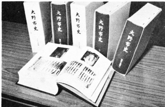
興味深い史料が収録されている第3巻