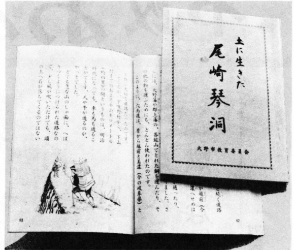
わかりやすくまとめられた琴洞伝

元治元年(1864年)水戸浪士事件のとき、大野藩が西谷村を焼き払った際、村民に自分の山の木を提供し、米や塩を贈ったり、和紙の改良を指導したりしました。明治21年の大野町の大火では、焼け出された人々を