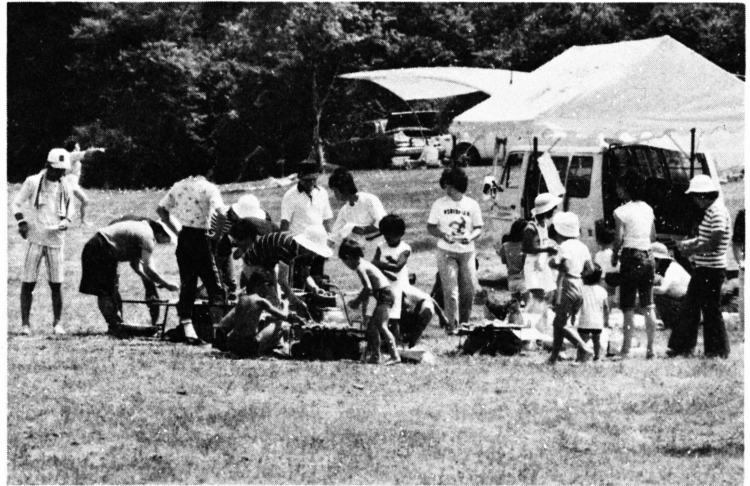
家族連れでにぎわった秋の里

一方、荒島・九頭竜峡と勝原は、勝原遊園の夏季休業などによって一般行楽客が減ったためであり、六呂師高原は円山公園の整備工事が影響