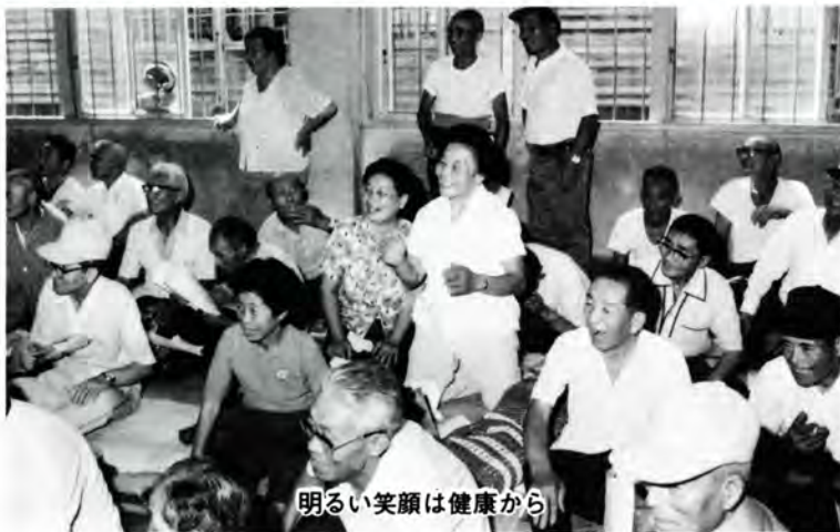
明るい笑顔は健康から