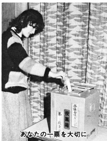
あなたの一票を大切に

4月4日(月)富田小学校体育館 5日(火)上庄小学校体育館 6日(水)下庄小学校体育館 7日(木)有終西小学校体育館 どの会場も午後7時からです。