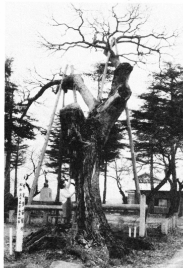
衰えが著しい大エノキ

市文化財保護委員会と市森林組合の調査でも、再生の見込みがないと診断されていました。