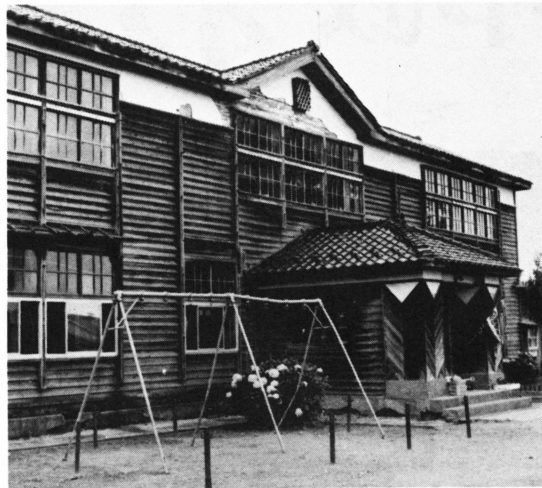
改築される上庄幼稚園