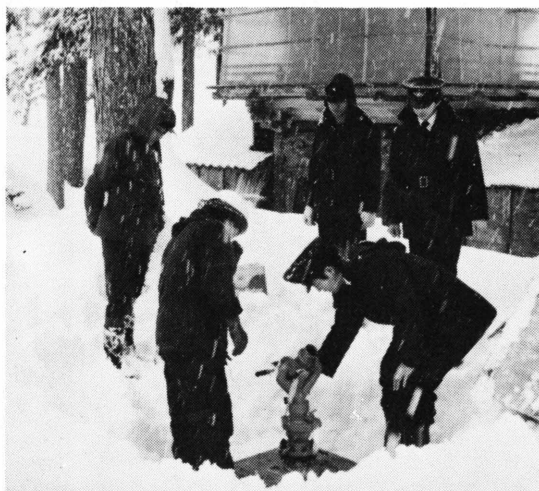
万一に備えての文化財防火査察(宝慶寺)