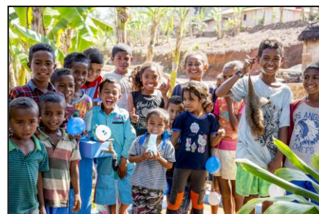
東ティモール民主共和国の子どもたち

⇒本市の誇りである水を活用した取り組みである「水への恩返し Carrying Water Project」により、東ティモール民主共和国への寄付目標額を達成することができた。また、化石発掘体験センターを拠点として、化石資源を活用した観光誘客に取り組んだ。