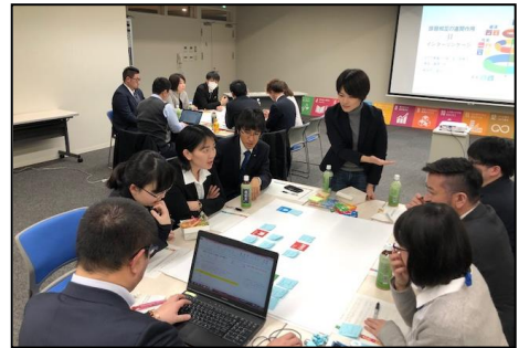
SDGsをテーマとした若者座談会

⇒健全な行財政運営に努めながら、地方創生・人口減少対策の各施策を推進するとともに、情報発信にも積極的に取り組んだ。また、新たな取組みとして、国際的な目標であるSDGsの推進にも取り組み始めた。