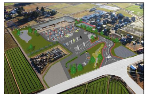
道の駅完成イメージ図