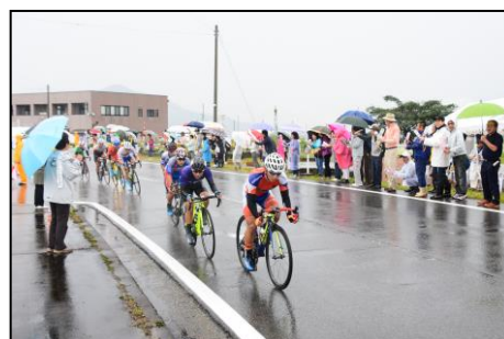
福井しあわせ元気国体・元気大会