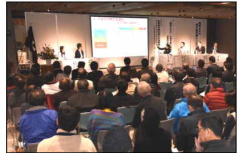
空き家対策シンポジウム

⇒高齢者に対する充実した福祉・医療サービスを維持するとともに、高齢者の活用や活躍の場の推進を図った。また、安全で安心なまち実現の一環として、空き家の解消や活用について、市全体で考えていく機運の醸成を図った。