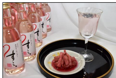
名水を活用した新商品「名水すこサイダー」

⇒越前おおのブランドの積極的な情報発信による観光誘客を行うとともに、将来の観光面の受け皿の核となるDMOの設立について検討した。また、新たな産業団地の整備に着手するとともに、企業誘致活動に力を入れ、IT企業のサテライトオフィス誘致に成功した。農林業分野では、地域おこし協力隊も活用しながら、鳥獣害対策に取り組んだ。