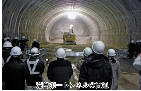
荒島第一トンネルの貫通