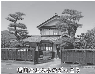
越前おおの水のがっこう

た。これは今まで「当たり前」と思い込んでいた方法を見直すチャンスとも捉えられる。これを機に検証を行い、イベントの在り方等をリニューアルするなどコロナ禍が収束し、イベントが開催できるようなった際には、多くの方々が来場する、より魅力的なイベントとしてにぎわいが創出されるよう取り組みたい。