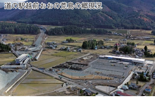
道の駅越前おおの荒島の郷現況

人口が減少する中で、本市においては中部縦貫自動車道や北陸新幹線の延伸、道の駅越前おおの荒島の郷の開駅など、かつてないチャンスがあり、この先10年の取り組みを決める大事なものとなる。チャンスを生かすためには、地域力や市民力、そして職員力をうまく組み合わせることが重要であり、行政は、市民に分かりやすい総合戦略を作り、市民に伝え、市民に参加してもらえよう努めなければならない。