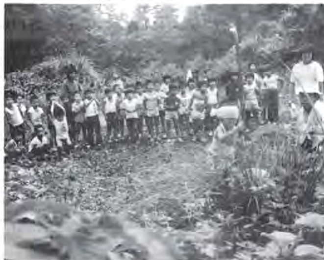
林間保育(奥越青少年の森)

答 ことは料金改定の際、高額所得者層に比べてアップ率を低くし、昨年の倍額の一般財源を持ち出した。国の基準では措置費の56%（昨年は50%）が保護者負担の割合で、年々高くなってきているが、財政状況を見て考えていきたい。しかし応分の負担はある程度やむを得ないと思う。