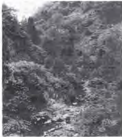
県がダム建設を示唆している赤根川上流(阿難祖領家)

県耕地事務所と協議し国の特別調査費をもらうよう検討している。一部集落の水不足は県営事業でポンプを打ち込むことで手配してある。