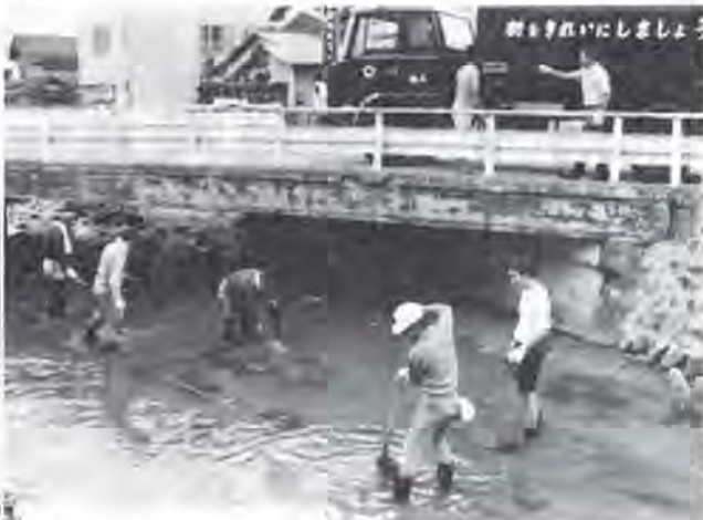
河川をきれいに(社会奉仕作業)

答 市の河川手や道路手が協力して河川のごみ処理に努力しているが、結局は市民1人ひとりのモラルの問題であると思う。市民の協力を積極的に呼び掛けたい。ごみ取り機の設置については、機能を発揮するものかどうか早急に調査したい。