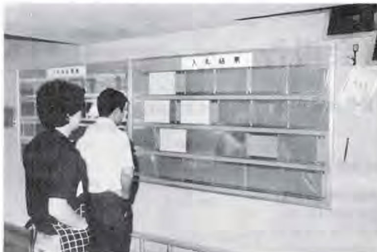
入札結果の公表 (庁舎内で七月十五日から実施)

答 中央建設審議会から指名業者増と結果公表が好ましいとの通達があったので、実施することを決めた。指名業者増は現在実施中であるが、公表については工事金額をどの程度にするかまだ決めていない。早急に決定して公表に踏み切りたい。