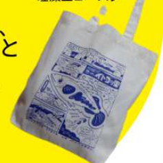
コットントートバッグ