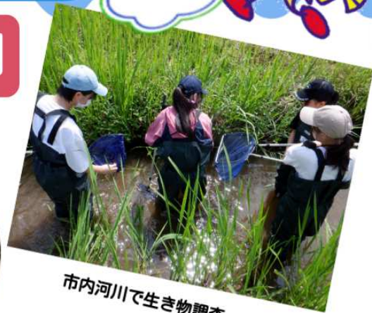
市内河川で生き物調査