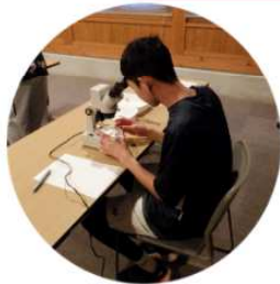
イトヨの体を顕微鏡で観察