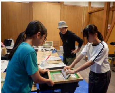
活動Tシャツをみんなで制作