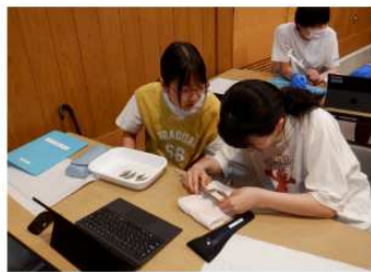
イトヨの大きさを測ったよ