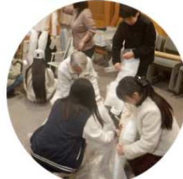
鳥よけのかかしづくり