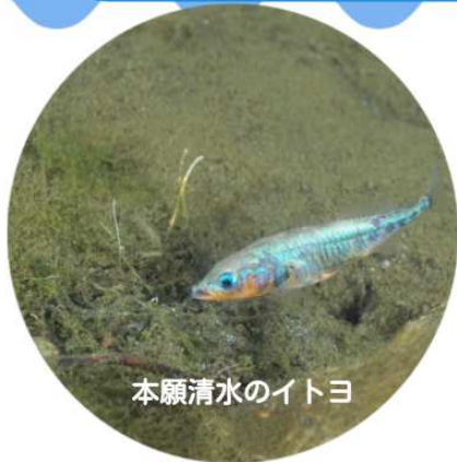
本願清水のイトヨ