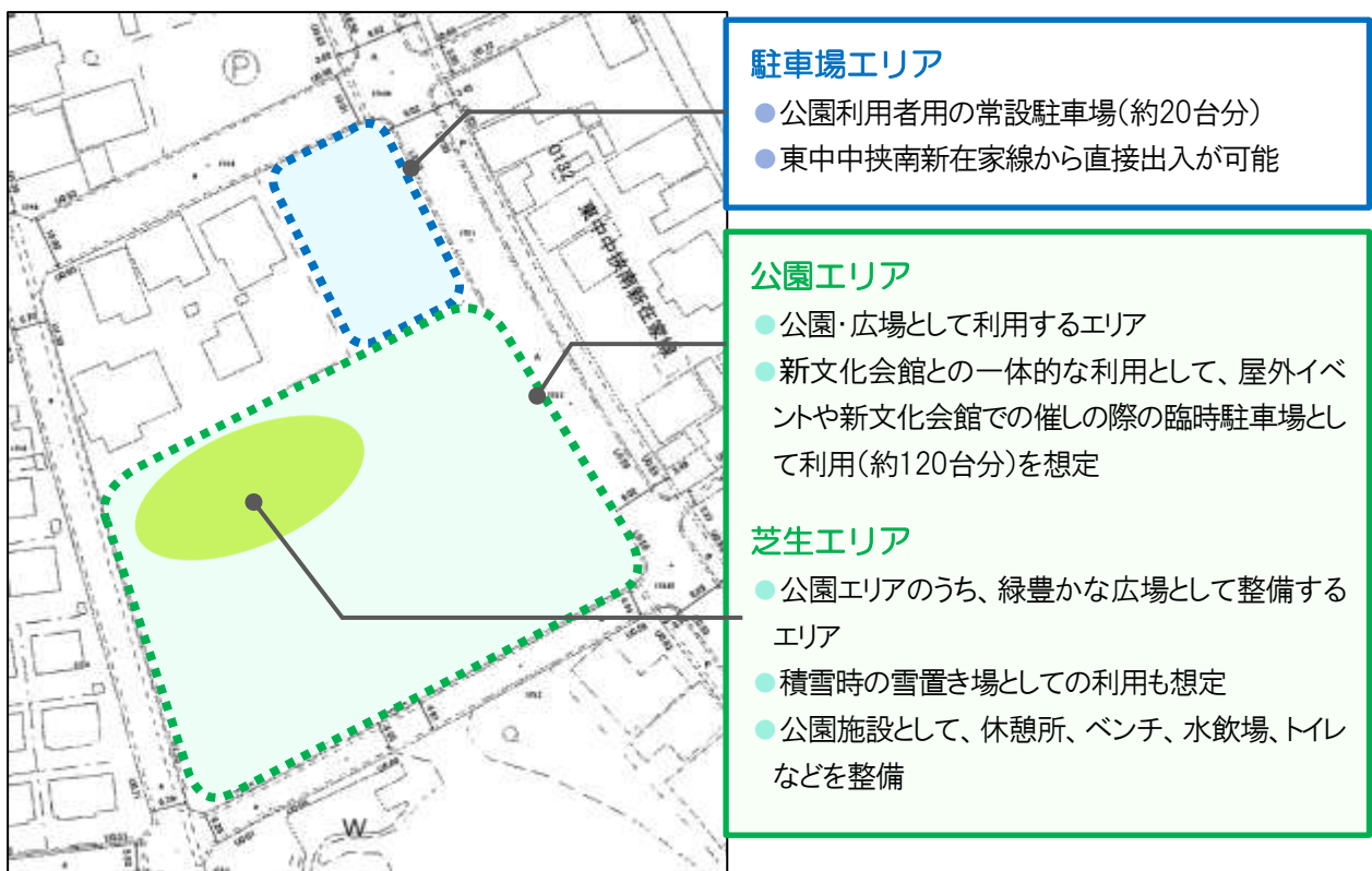
新駅東公園の整備方針図