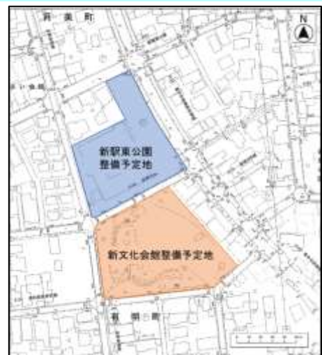
事業予定地の敷地概要

現駅東公園の敷地に新文化会館を整備した後、現文化会館の敷地に新駅東公園を整備します。