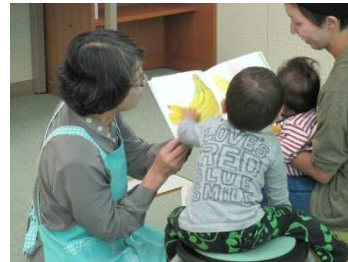
ブックスタートの様子

大野市図書館は、ブックスタートをはじめ乳幼児を対象とした事業を実施しています。家庭における読書の大切さを理解してもらうためにも、事業を継続して行う必要があります。