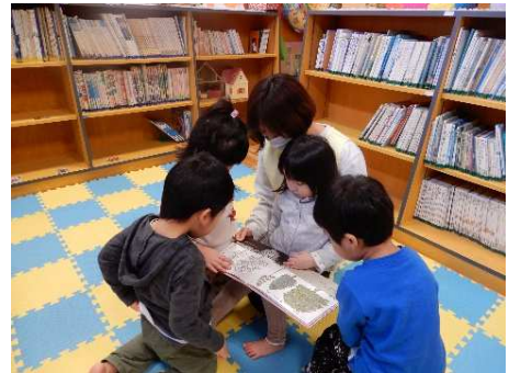
園での読み聞かせの様子

乳幼児期に絵本や物語の楽しさを味わい、さまざまな本との出会いの機会をつくるため、園は、毎日絵本の読み聞かせや紙芝居などを行っています。また、年齢に応じた図書コーナーを設けて、子どもが自由に絵本を手にとって見ることができる居心地のよい場所となるように環境を整えています。