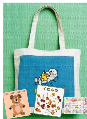
ブックスタートでプレゼント

また、保育所や認定こども園、小学校、児童センターでの読み聞かせ(※3)も定期的に行われ、読み聞かせボランティアの活動も活発に行われるようになりました。そのほか、「メディアコントロールチャレンジ」(※4)などデジタルメディア機器の使用に対する取り組みについても、子どもの年齢に応じて実施しています。