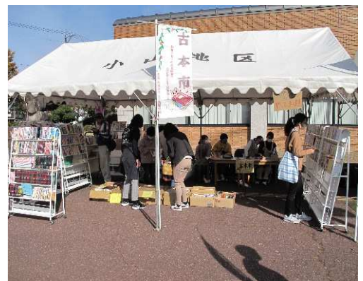
「図書館部」による古本市 大野市図書館まつり

大人に対しては、子どもに質の高い本を届けるために絵本について学ぶ「絵本の部屋」や講演会を開催するなど、研修の機会を提供しています。乳幼児や児童生徒に対する読み聞かせ技術の向上や内容の充実を目的として、平成21年度から「絵本読み聞かせボランティア養成講座」を開催し、読み聞かせができるボランティアの育成を図っています。令和3年度には、63名が登録しており、大野市図書館での「読み聞かせ会」や「ブックスタート」、保育所や認定こども園、学校などで読み聞かせボランティアとして活動しています。