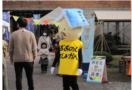
「おとしょちゃん」の着ぐるみ 大野市図書館まつり

また、大野市図書館における子どもの読書活動を推進するために、司書の専門的な研修が必要です。