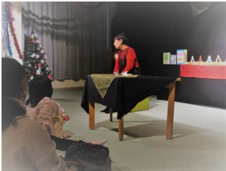
「おはなし会」 大野市図書館クリスマス会

子どもたちにとって図書館は、豊富な蔵書の中から読みたい本を自由に選び、読書の楽しみを知ることができる場所であるとともに、保護者にとっても子どもと一緒に本を選んだり、司書に相談をする場所です。