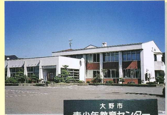
大野市 青少年教育センター Ono city Youth Education Center