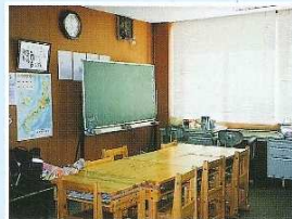
適応指導教室（フレッシュハウス）