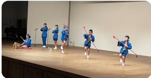
大野市が待ちに待った降雨もこの雨乞い踊りのおかげかもしれませんね