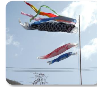
元気に泳ぐ、鯉のぼり (朝日)