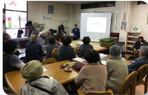
【山崎先生のちょっとイイ話】