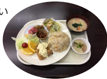
【より処・ワンコイン♪ランチ】