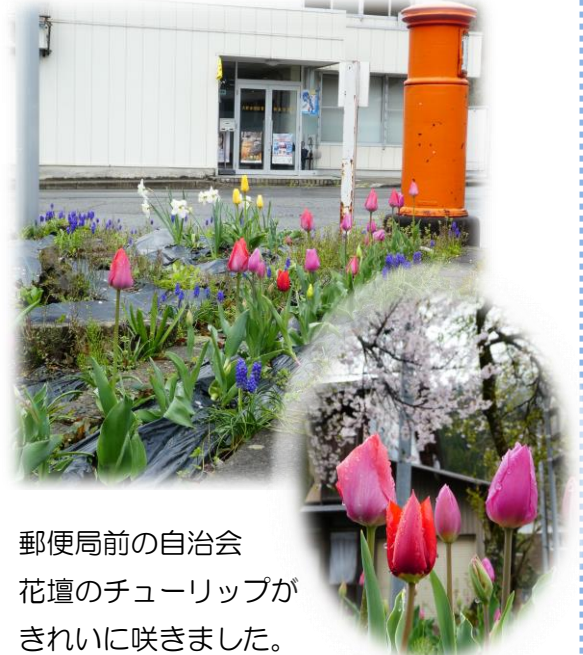
郵便局前の自治会 花壇のチューリップが きれいに咲きました。