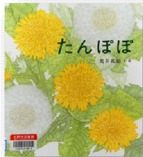
■『たんぽぽ』 荒井 真紀 著