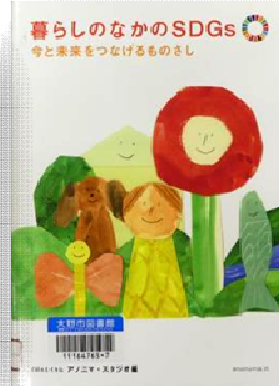
■『暮らしの中のSDGs』 アノニマ スタジオ 編