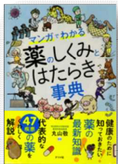
■『薬のしくみとはたらき事典』 丸山 敬 監修