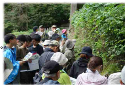
立ち止まってる説明