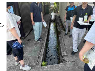
流雪溝の調査の様子