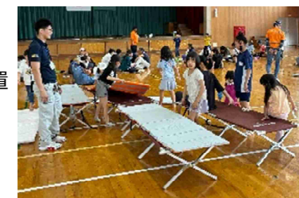
防災体験で簡易ベッドを設置