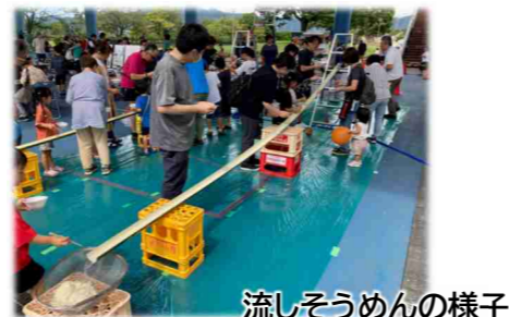
流しそうめんの様子