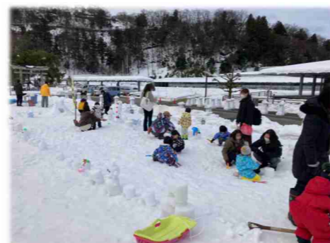
多くの一般参加者が雪の装飾を楽しむ