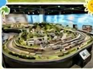
ジオラマ館の見学