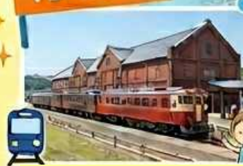
敦賀赤レンガ倉庫の見学