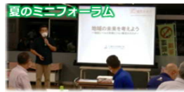
夏のミニフォーラム 地域住民一人ひとりが地域課題に関心をもち、取組に対する機運醸成！

大野地区では、地域の課題解決に向けて取組を進めています。令和5年度には、アンケート調査を実施する予定です。ご協力をお願いします。