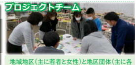
プロジェクトチーム 地域地区（主に若者と女性）と地区団体（主に各校区）から構成、取組企画や調査方法を検討！