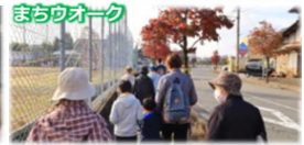
まちのオウク 地域の宝の再発見、地域への誇りや愛着の醸成 地域課題に主体的に取り組む意識醸成！