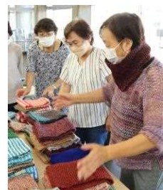
編み物を愛する会