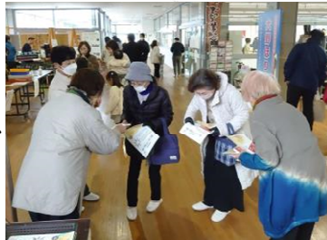
大野ほりでいでのPR活動