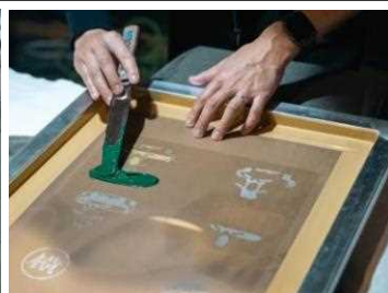
シルクスクリーン体験