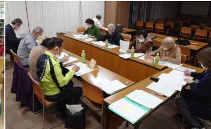
メンバーが集まり、毎月話し合い