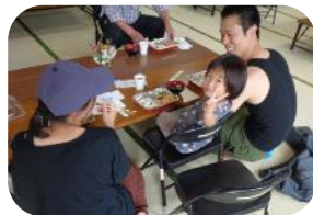
6月のお弁当はえんどう豆ごはんや里芋コロッケでした。

新しいメンバーが加わり、現在9名で活動中です。6月から公民館の和室での会食が再開しました。相席をしたり、おしゃべりしながら賑やかに食事をすることが見られました。7月も和室で食えることができます。ご家族やご友人と会話を楽しみながらお食事してみたいかたがどうか。和室で食える場合は、味噌汁とお茶をサービスさせていただきます。これまでどおりお持ち帰り頂いても構いません。