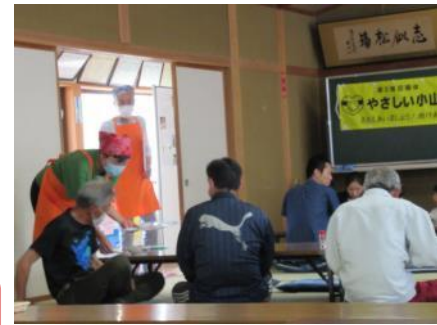
▲そば会「ささえ愛亭」の様子

6月15日に第44回会議を開催し、そば会「ささえ愛亭」開催の最終確認と「憩いの場」づくりなどについて協議しました。6月18日の「ささえ愛亭」に多数のご参加とアンケート調査へのご協力ありがとうございました。いただいた貴重なご意見は、今後の活動に役立ててまいります。ささえ愛隊では小山地区の方々憩いの場となる居場所づくりと、移動手段の無い方への支援の具体化に向け、活動してまいります。