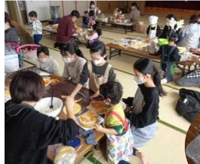
親子35人集まり賑やかでした。

12月10日(日)にクリスマス会を開催しました。ケーキのデコレーション・紙皿リースの工作・会食をしました。新しい会員として2家族増えました。久しぶりに会食をすることが出来てわいわい楽しい時間を過ごせました。