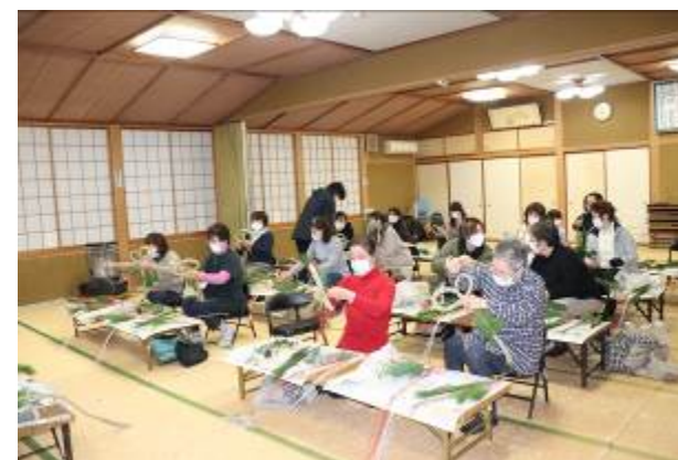
12月18日(金)、文化講座に参加されたみなさんで正月飾りを作りました。

旧年中は公民館活動にご協力、ご支援をいただき厚く御礼申し上げます。 本年もどうぞよろしくお祈り申し上げます。