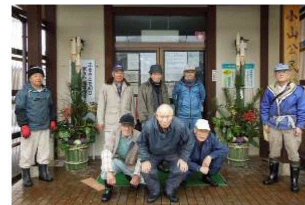
12月21日(月)、小山福寿会のみなさんに見事な門松を作っていただきました。