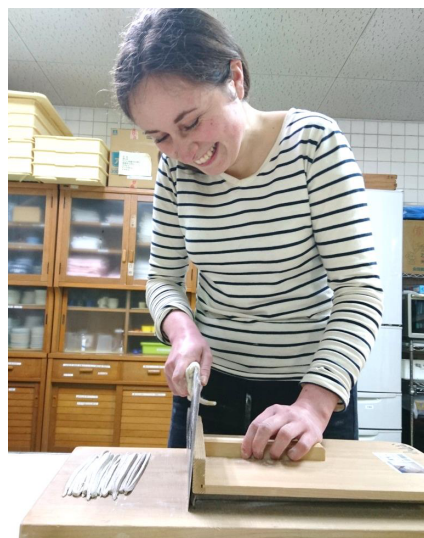
マチルドさん初めての挑戦！ 太い麺が出来上がりました！！